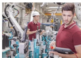
Produktion und Digitale Transformation