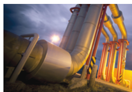
Nachhaltige Energie- und Versorgungswirtschaft